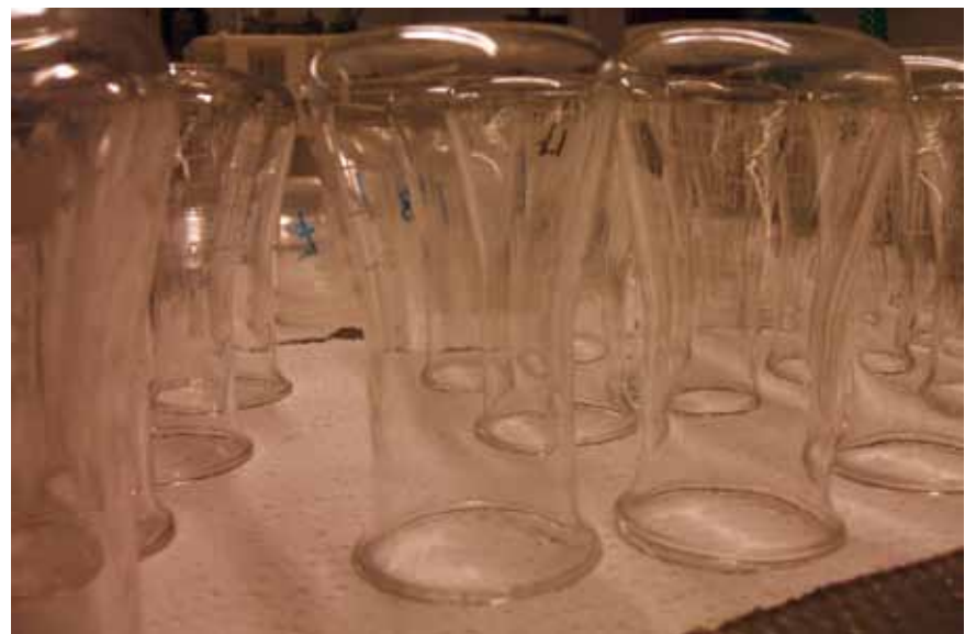
En heel veel glaswerk...