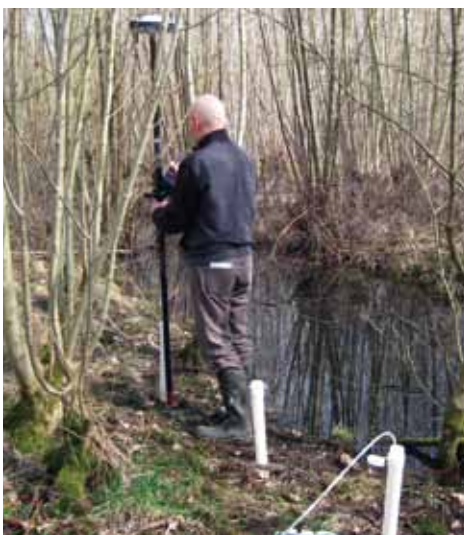
De peilbuizen worden aangebracht.

Daarnaast is de basecapaciteit van de bodem van belang: door zure regen (ook